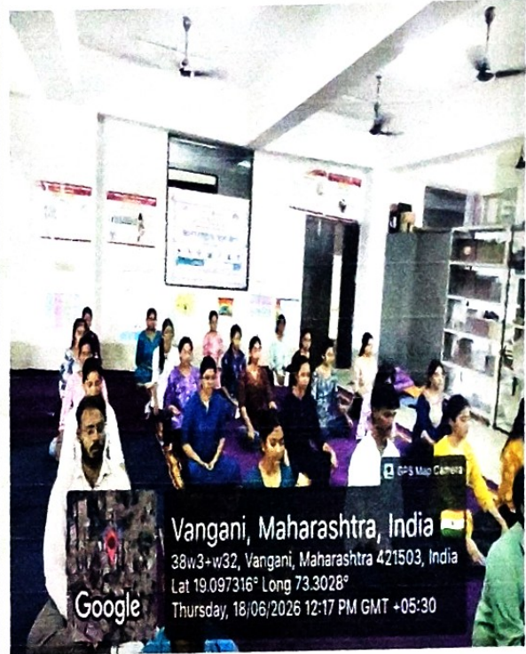
छायाचित्र क्र. ...8 :