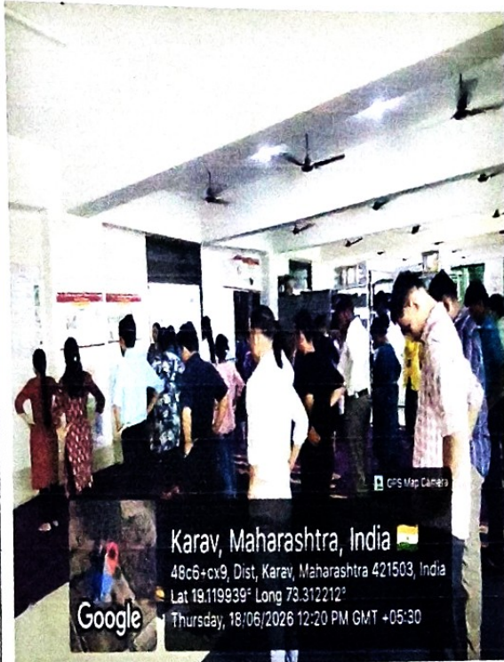
छायाचित्र क्र. ...7. :