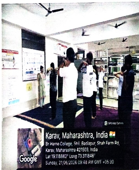
छायाचित्र क्र. ...9 : .....